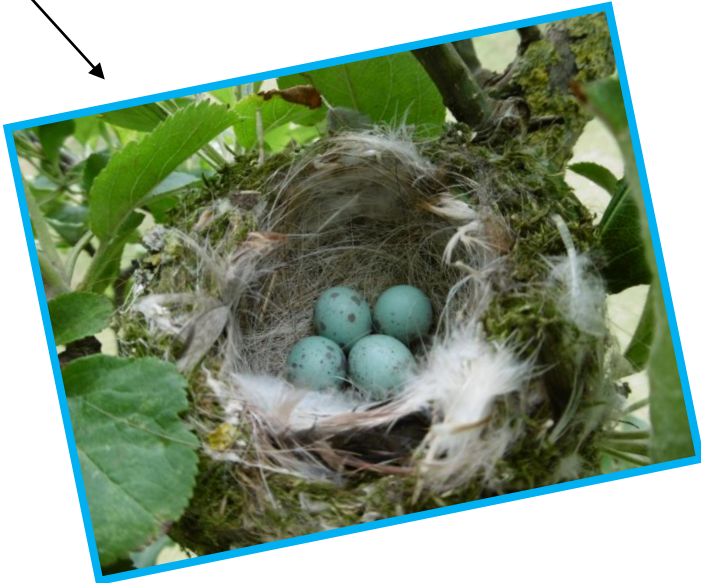
Prachtig, hè, dit nestje van de Blauwe Korenmus!