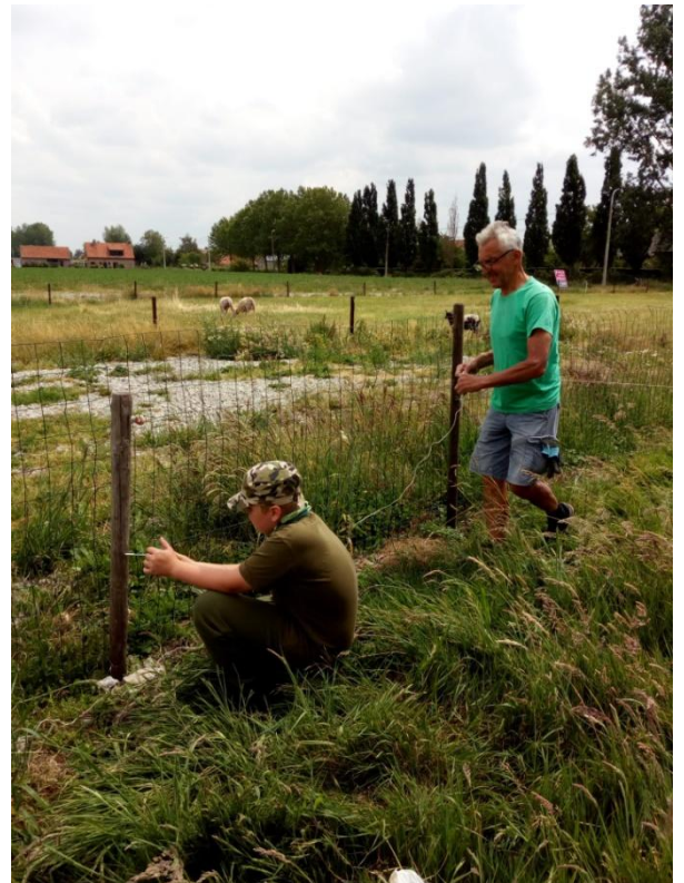
Hekken herstellen zodat de schapen niet ontsnappen!