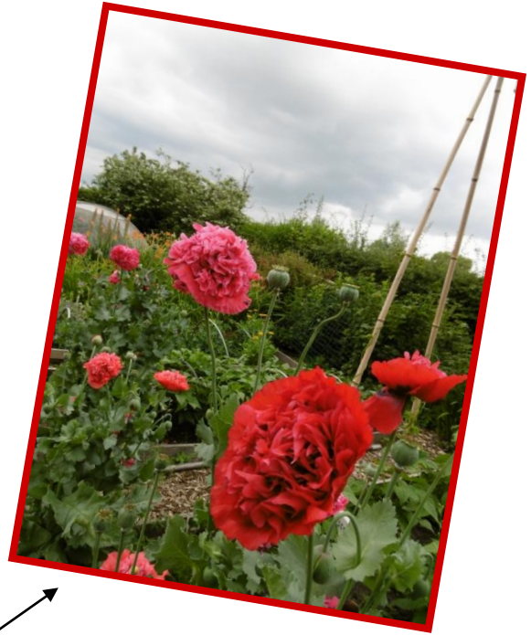
Papavers in overvloed in de moestuin..