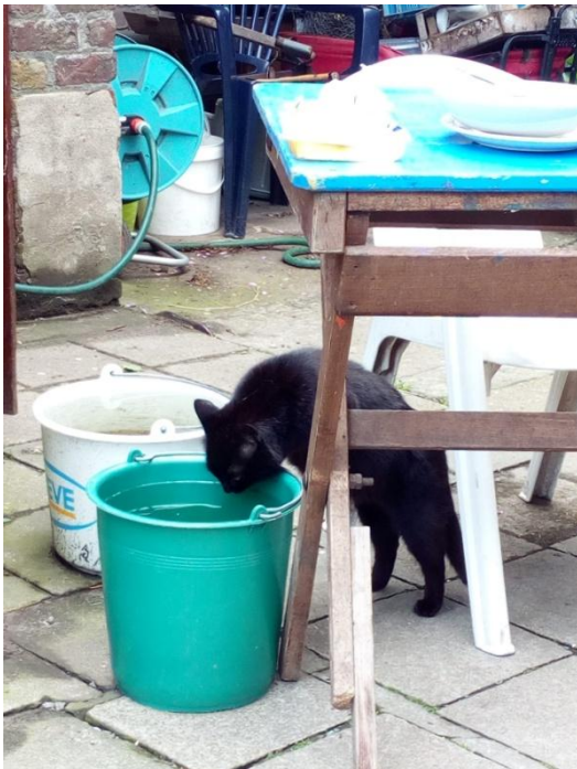
Zééér dorstige kat ☺