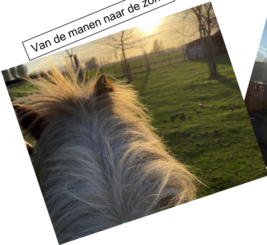
Van de manen naar de zon!