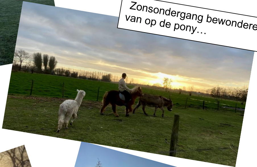
Zonsondergang bewonderen van op de pony...